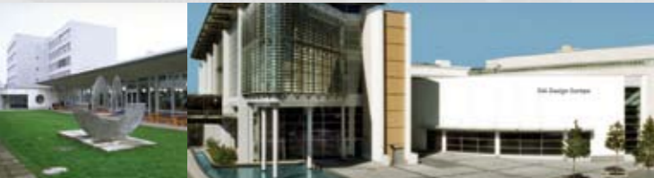
Hochschule Rhein-Main Intern. Entwicklungszentrum GM/Opel

Zentraler Standort mit Zukunft. Central Location with a Future.