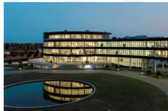
Europäisches Entwicklungszentrum / European Development Center Hyundai + KIA

Standort der Wirtschaft von morgen Business Location of Tomorrow