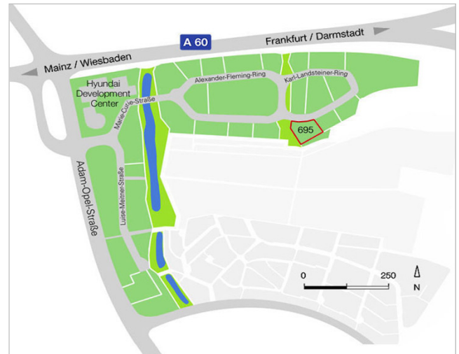
Lage des Grundstücks im "Blauer See Businesspark"