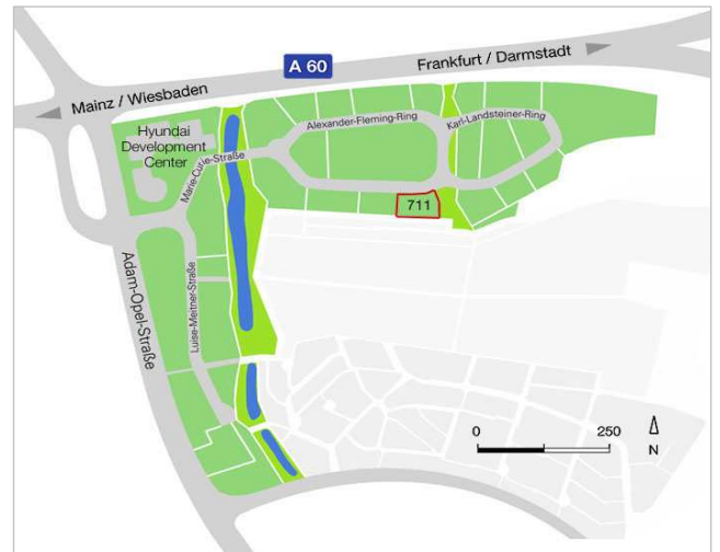
Lage des Grundstücks im "Blauer See Businesspark"