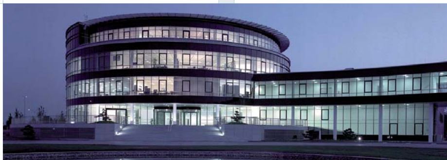
Rüsselsheim als Standort für Bildung und Forschung