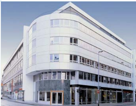
M3234 in der Marktstraße

Die Büromarktanalyse macht deutlich, dass mit den Teilmärkten City, Hasengrund, Blauer See und sonstigen Standorten das verfügbare Flächenangebot marktgerecht ist und attraktive Flächen in ausreichender Zahl vorhanden sind. Der Gewerbepark Blauer See