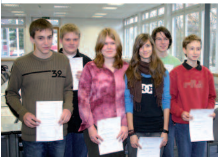
Die Erstplatzierten beim Top Tech Stars-Wettbewerb der Fachhochschule